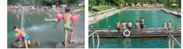
Bilder bestehender Naturbäder